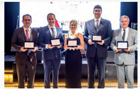
Diretoria homenageada com placas