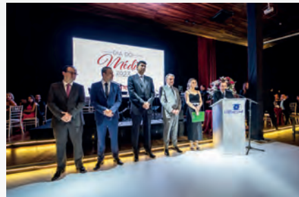
Diretoria que encerrou a gestão 2021/2023