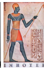
Imhotep e sua significação. Não há imagem confiável dele