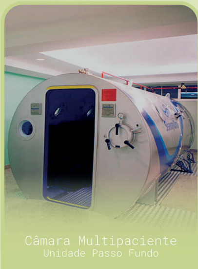
Câmara Multipaciente Unidade Passo Fundo

Os candidatos eleitos serão empossados no dia 21/10/2023, no jantar baile em comemoração ao Dia do Médico.