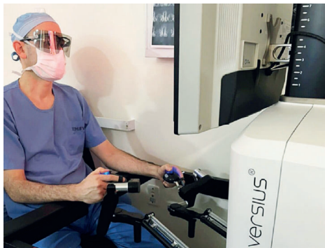
Texto: Ana Paula Koenemann - Comunicação HSVP

cirurgião especialista no Aparelho Digestivo disse estar honrado por oportunizar novos tratamentos para a população. "A cirurgia robótica vem progressivamente ganhando espaço no tratamento de inúmeras doenças e em várias especialidades médicas e promovendo melhorias na recuperação dos pacientes. Sendo assim, foi uma honra para o Hospital São Vicente de Paulo e para toda a equipe atuar de forma pioneira com este tipo de procedimento na plataforma robótica", disse o médico do HSVP.