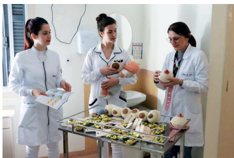
Ações educativas sobre amamentação são realizadas pela equipe multiprofissional no HSVP em alusão a campanha Agosto Dourado

Quando um bebê nasce, a Instituição prioriza a "hora de ouro", ou seja, a primeira hora da mamãe com o recém-nascido. O hospital busca promover um contato 'pele a pele', estimulando o recém-nascido precocemente a pegar o peito da mãe.